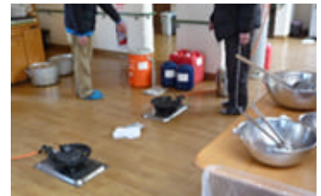
ある老人ホームでの風景。 頻繁に起こる余震に備えてコンロはすべて床に。