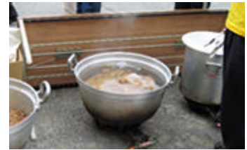
風で火が…。 屋外ではお湯を沸かすのにも一苦労します。

まず、火力の調整が上手くできません。そして、煙がとにかく大量で、ものすごい臭いが…。使用後の後片付けも毎回大変でした。